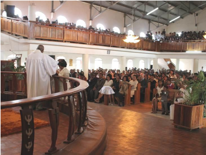
Fullt hus under misjonærinnvielsen i Tanjombato 21. april.