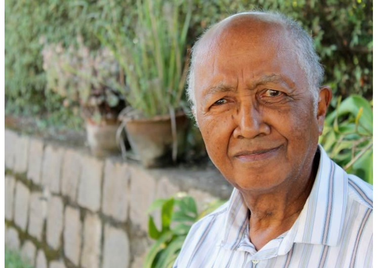
Tekst og foto: Kristoffer Hansen-Ekenes

Født 1936 i Antananarivo Gift med Claire 4 barn