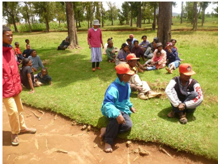
Noen av beboerne på Mangarano.

NMS fortsetter å gi støtte til driften av dette senteret. I årene 2007-2008 bidro NMS også til rehabilitering av mange av husene. De spedalske på Mangarano er ikke glemt, selvom det er mange utfordringer knyttet til dette arbeidet.