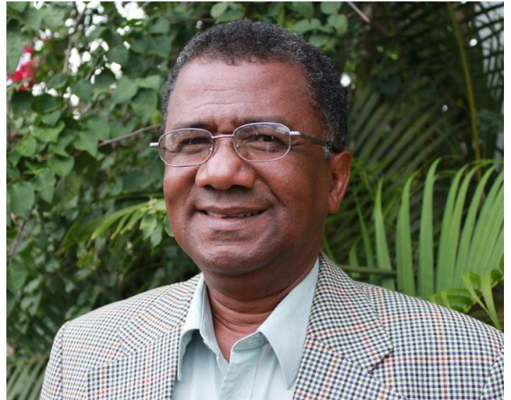
Tekst og foto: Lilliann E.R. Våje

Registrert i 1956 i Morondava (Egentlig født i 1955 i Tongobory, Betioky) Gift med Soriny Germaine, 5 barn