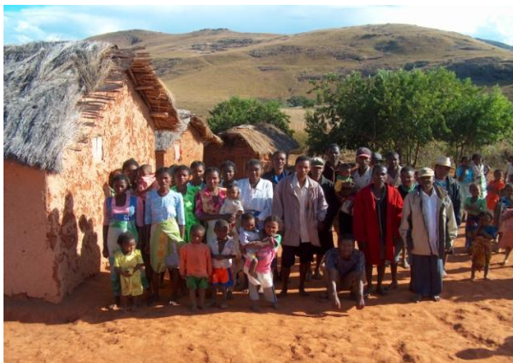
Folk i Jerosalema og fra nabolandsbyane samlast på søndager.