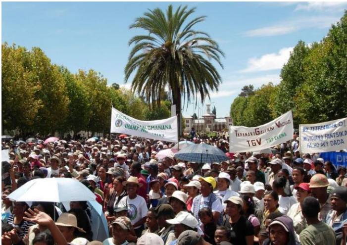
Demonstranter i Antsirabe i mars 2009.

En gruppe pastorer i Den reformerte kirke (FJKM) har i den senere tid ledet demonstrasjoner mot den politiske utvikling på Madagaskar. Paroler ladet med politisk innhold følges av gudstjenester med forbønn for land og folk. En av pastorene ble skutt under alvorlige sammenstøt mellom militære grupper i forbindelse med en demonstrasjon 20. mai; han døde dagen etterpå av skuddsåret og stort blodtap. En annen pastor ble arrestert i kjølvannet av samme demonstrasjon. Omtrent samtidig ble også den reformerte radiostasjonen Fahazavana i hovedstaden stengt, angivelig på grunn av oppvigleri og desinformasjon.