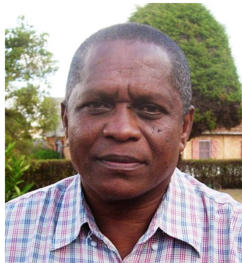
Tekst og foto: Lilliann E. R. Våje

Født 19. september 1958 i Morombe Gift med Elanirina Juinline 5 barn