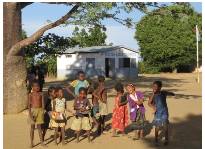
Glade skolebarn utenfor skolen i Vorehe.

Mikeafolket forble i skogen da koloniherrerne overtok makten mot slutten av det 19. århundre. De levde av det de fant i skogen, av rotfrukter, villsvin, perlehøns, villhonning og forskjellige frukter. Behovet for drikkevann fikk de dekket gjennom vannholdige rotfrukter. Flertallet kunne verken lese eller skrive, og dødeligheten var høy p.g.a. dårlig hygiene og mangel på helsetjeneste. Mange går i dag på skole, og et økende antall syke benytter seg av helsetilbudet i Vorehe.