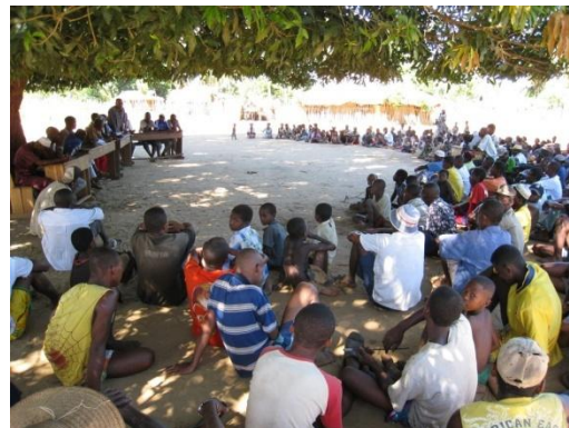
Landsbymøte i Onara.

Takk til dere som støtter Shalom, Prosjektnummer 623 356, NMS gavekonto: 8220 02 85030.