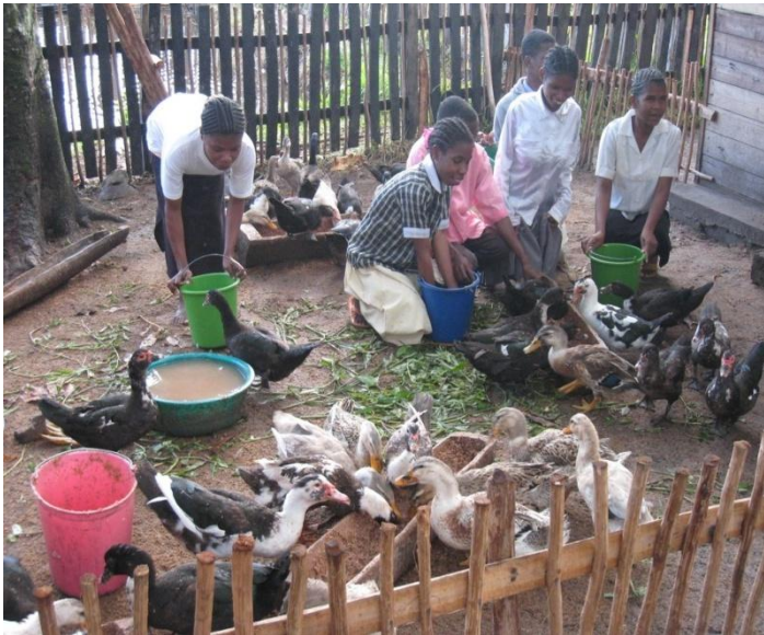
Blinde elever i andegården i Farafangana.